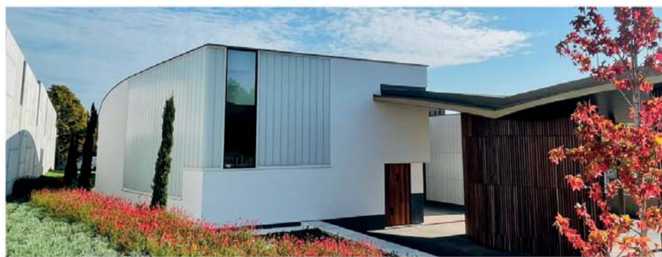
Tanatori de Cerdanyola

Truyols Serveis Funeraris disposa de centres a Sant Cugat del Vallès, Cerdanyola del Vallès, Ripolllet, Rubí, Santa Perpètua de Mogoda, Barberà del Vallès i Sant Quirze del Vallès.