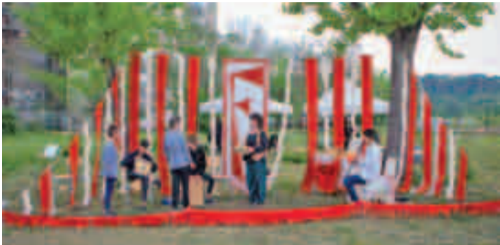
La decoració va ajudar a recrear l'ambient medieval.

L'Institut Federica Montseny, de Badia, es va convertir, per segon any, en un poble medieval amb una àmplia oferta de jocs de l'època i actuacions de l'alumnat i del professorat, que es van inspirar en la iconografia i usos i costums d'aquest període històric.