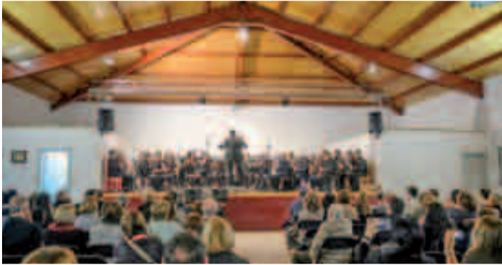
El concert va oferir cançons populars de Phil Collins i Céline Dion, entre altres.

L'Agrupació Musical de Badia del Vallès, juntament amb la Banda i Veus de l'Escola de Música d'Arenys de Mar, va oferir, el 23 de març, un gran concert on va interpretar cançons d'estrelles de la música com Phil Collins, Céline Dion, Cole Porter, Bruno Mars, ABBA i Lady Gaga, entre altres.