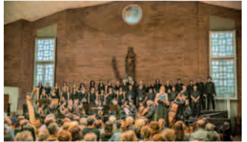
El concert va ser un gran espectacle de veus per interpretar el Rèquiem de Fauré.

vendre les entrades mitjançant un micromecenatge al web Verkami que va aconseguir, amb escreix, els ingressos necessaris per dur a terme l'actuació.