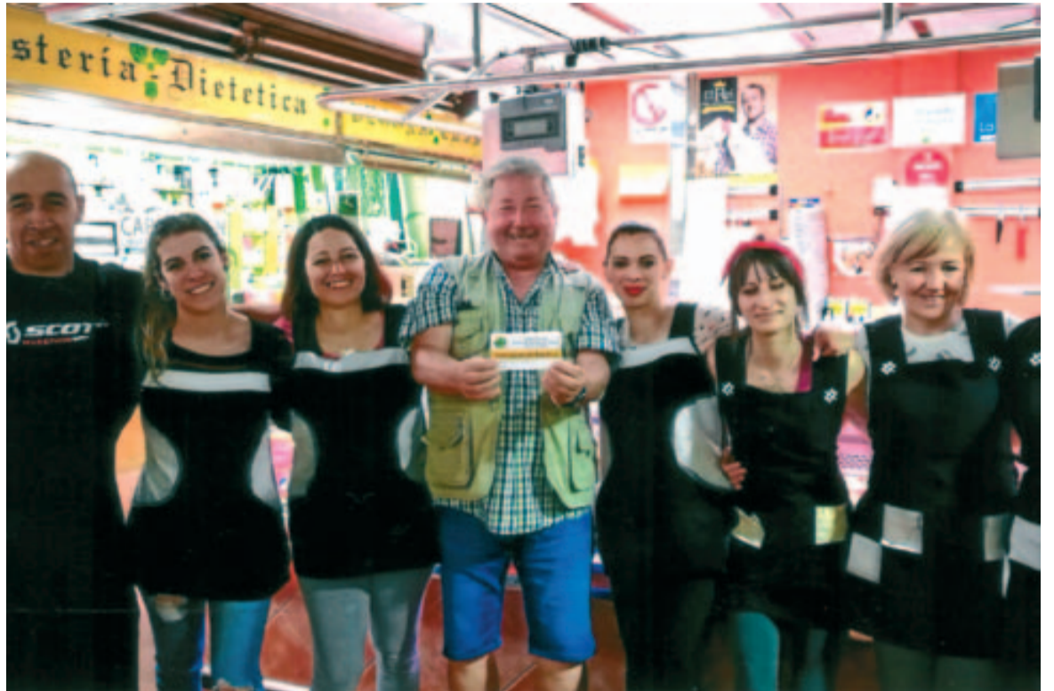
El mercat municipal reparteix premis setmanalment.

L'Ajuntament de Badia del Vallès vol felicitar tots els concessionaris participants del mercat municipal per aquest especial aniversari i els anima a continuar impulsant iniciatives com aquesta que, a més de fidelitzar els clients, fan del mercat un espai dinàmic i atractiu per anar a comprar dedicant temps per escollir i seleccionar productes de qualitat, com són els que s'ofereixen al mercat municipal de Badia del Vallès. ■