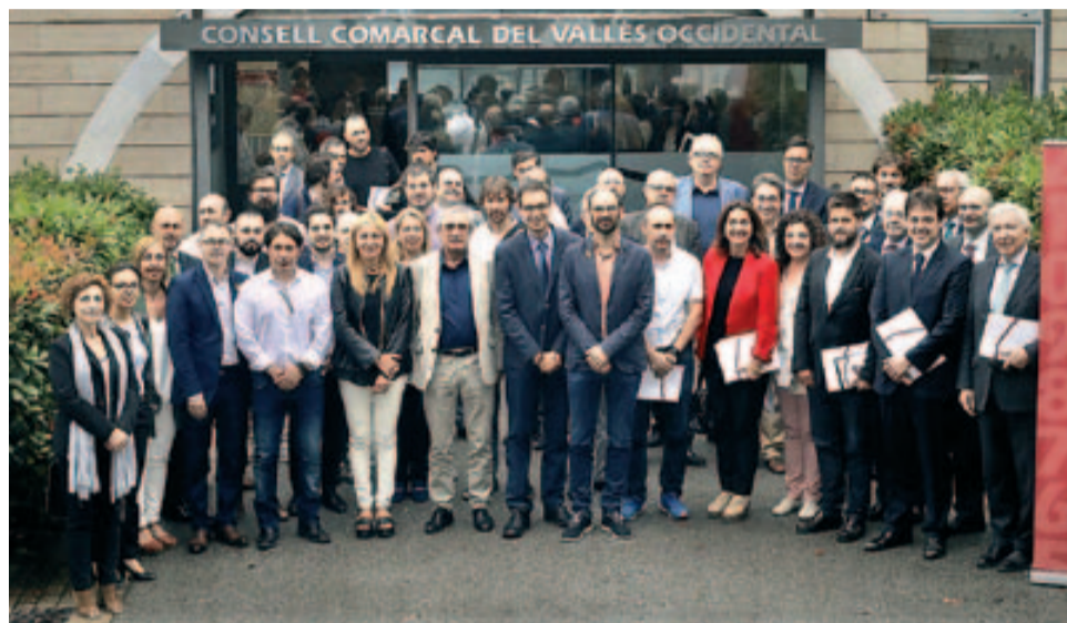
Foto de família dels participants en la reunió del pacte per a la reactivació de la indústria.

L'Ajuntament de Badia del Vallès va participar en el Plenari del Pacte per la Reindustrialització del Vallès Occidental que ha fet una aposta conjunta per la indústria amb l'aprovació d'un nou paquet de mesures i d'accions concretes fruit de la concertació entre els diferents agents del territori.