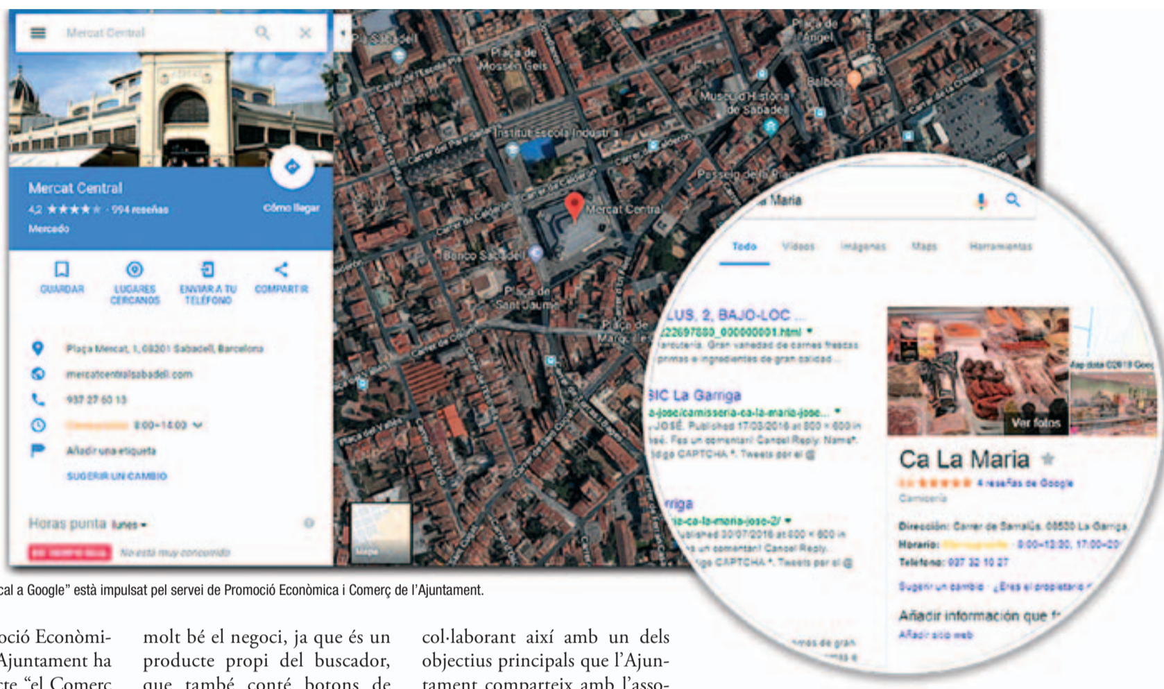
El projecte "el comerç local a Google" està impulsat pel servei de Promoció Econòmica i Comerç de l'Ajuntament.

El servei de Promoció Econòmica i Comerç de l'Ajuntament ha impulsat el projecte "el Comerç local, a Google", amb l'objectiu de donar l'oportunitat a tots els comerços de Badia del Vallès de dissenyar, elaborar i verificar fitxes Google My Business dels seus negocis.