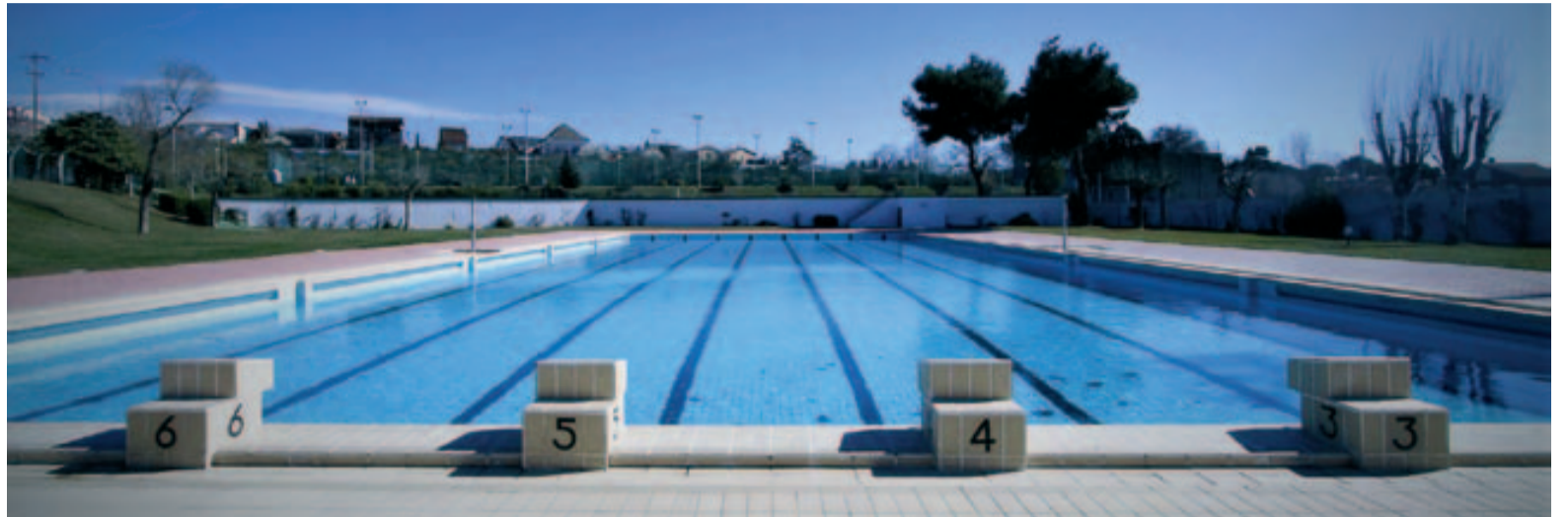
La temporada d'estiu de la piscina oberta durarà fins al 2 de setembre.

Gaudeix de l'estiu i fes esport, amb la piscina d'estiu de Badia! ■