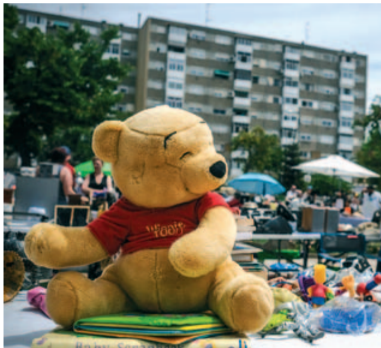
Tota mena d'objectes i d'antiguitats, en el Mercat del Trasto