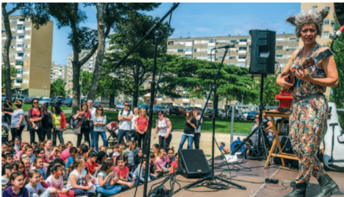
Un gran nombre de nens i nenes van col·laborar en el concert.

El projecte "Tenim Futur" impulsa, a partir d'experiències lúdiques, que els infants del municipi puguin començar a pensar en els seus projectes de vida, més enllà dels estereotips de qualsevol tipus. ■