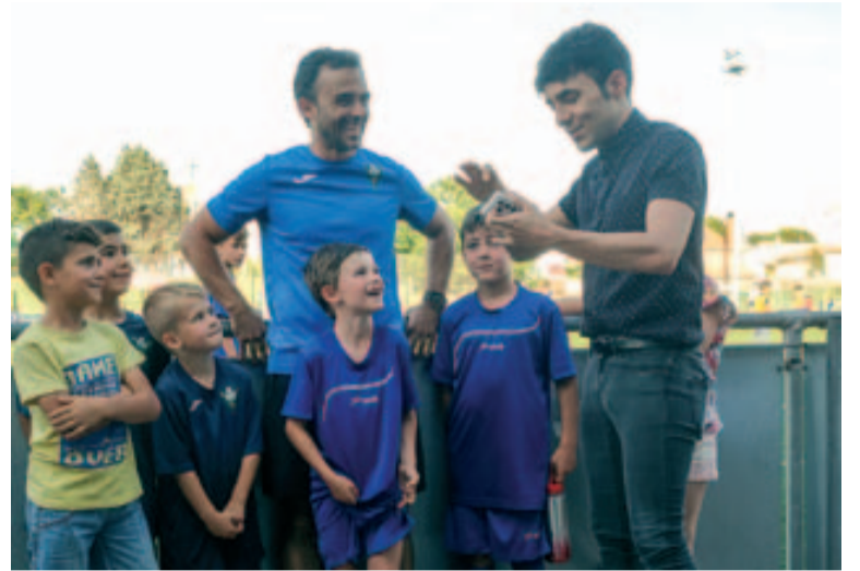
El programa va enregistrar llocs emblemàtics de Badia, com el camp de futbol.

juny, va atraure molts veïns, que volien participar i saludar personalment al mag. ■