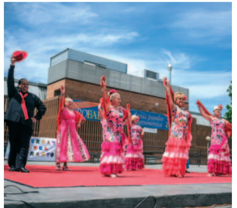
El mercat es va amenitzar amb actuacions