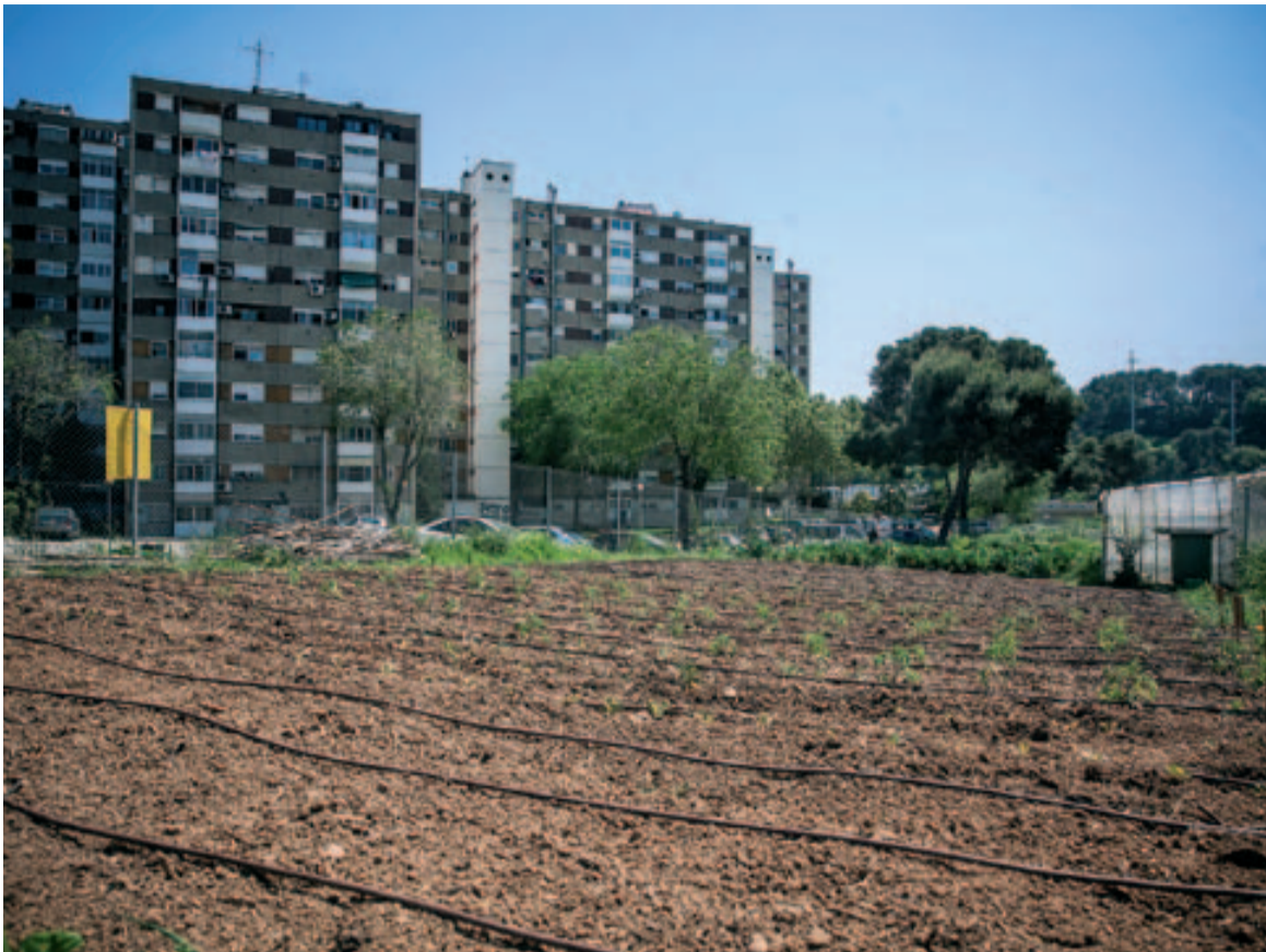
Els horts urbans faciliten la producció de proximitat per a l'autoconsum