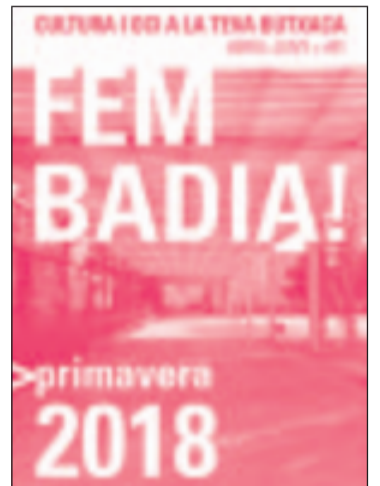
Portada de la revista Fem Badia!

L'agenda mostra la completa oferta cultural, lúdica i esportiva que es pot gaudir sense sortir de la ciutat: teatre, música, màgia i dansa, entre moltes altres propostes. La intenció de Fem Badia! És ser el recull de totes les activitats culturals que es facin al municipi durant cada trimestre.