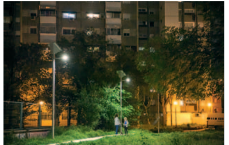
Lluminàries led, al camí des de l'aparcament del carrer Algarve fins al vial d'accés a Badia des de l'Ikea.

El seu funcionament és totalment autònom, ja que la placa solar fa de sensor lumínic i activa la lluminària quan disminueix la intensitat de llum ambiental. Així mateix, estan programades per disminuir la seva potència en un 30% des de les 12 de la nit fins a les 6 hores del matí; d'aquesta manera redueixen el seu consum i l'afectació lumínica al seu entorn durant la nit.