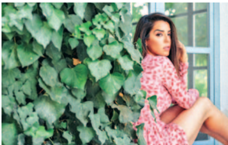
Imatge promocional de la cantant i compositora Ruth Lorenzo

Serà un xou súper energètic, ple de rock 'n' roll, musicalitat, veritat i força.