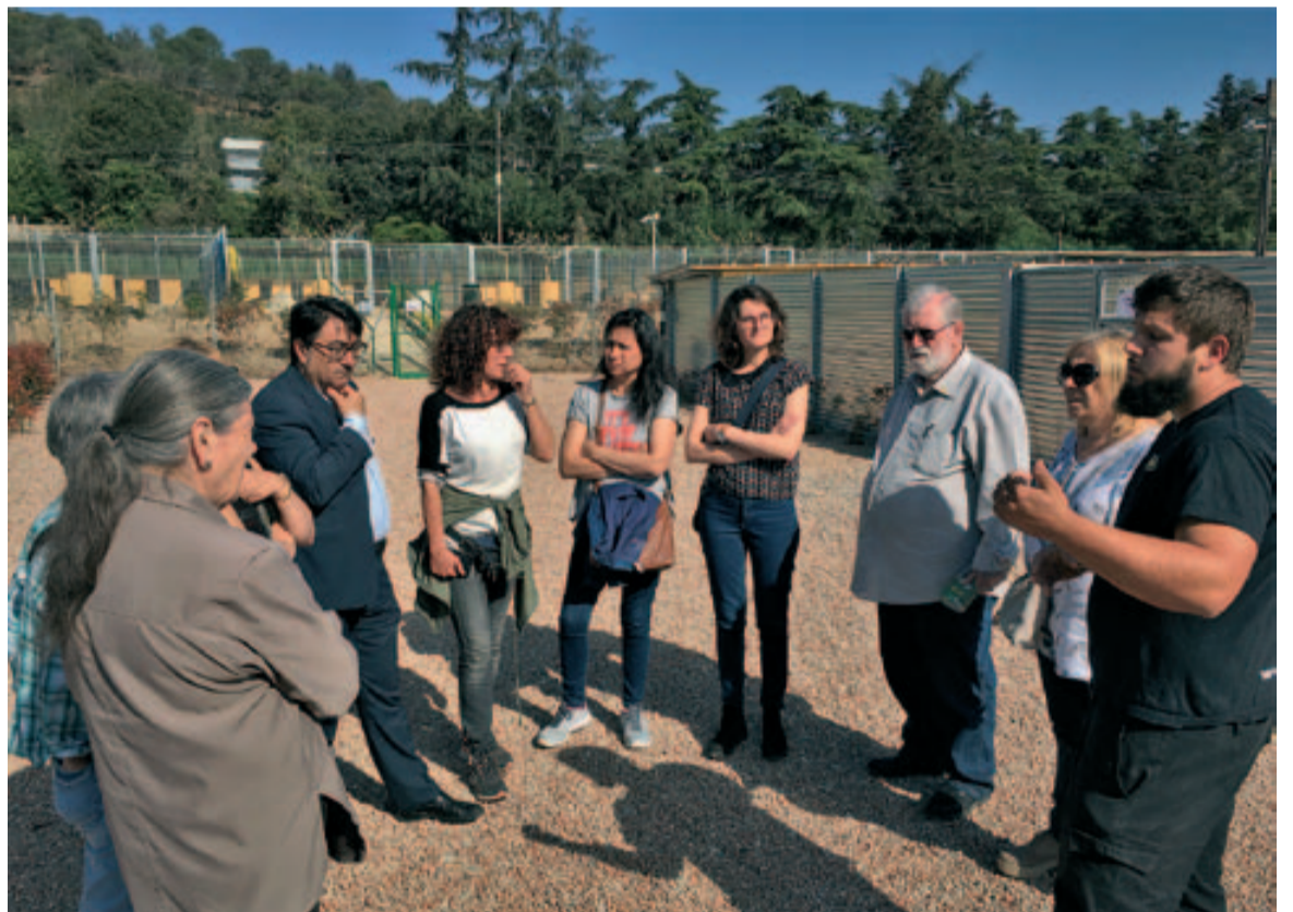
Visita a les instal·lacions on s'ubicarà la colònia de gats dels antics horts

En definitiva, que aquesta situació sobrevinguda i no desitjada per l'Ajuntament obre possibilitats de millora que cal aprofitar per al benefici de la població. Badia podrà disposar d'uns horts públics amb tots els requeriments i condicions per assegurar una bona gestió i que les persones que vulguin realitzar la pràctica de l'horticultura ho puguin fer amb totes les garanties. ■