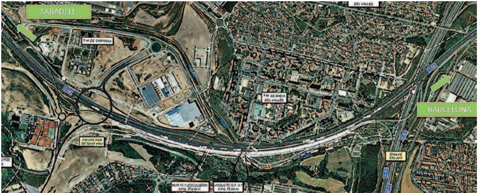
L'ampliació de la C-58 al seu pas per Badia afecta l'espai on se situaven els antics horts

Tota la producció haurà de ser per a autoconsum i no es podrà comercialitzar. Les persones que tinguin excedents de producció podran cedir voluntàriament una part, que serà destinada a programes socials de repartiment d'aliments.