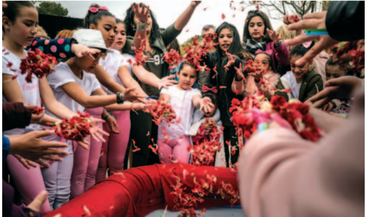
L'ofrena floral, moment especialment emotiu

La celebració del Dia Internacional del Poble Gitano data del 1971, quan es va celebrar el primer Congrés Mundial Gitano a Londres. Aleshores es va institucionalitzar la data del 8 d'abril, així com la bandera (dues franges horitzontals, una blava i una verda, amb una roda vermella al centre) i l'himne (Gelem, gelem). ■