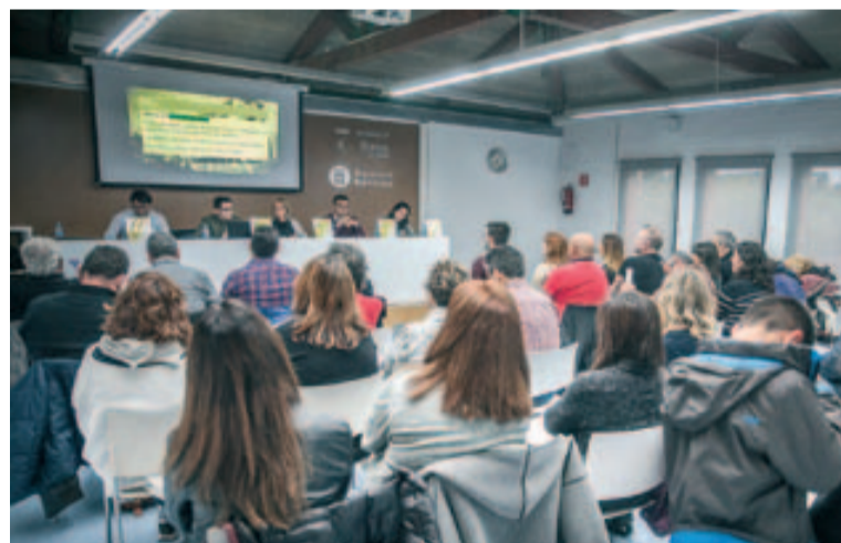
La presentació va tenir lloc a la Biblioteca Vicente Aleixandre

L'alcaldessa va respondre als assistents explicant que cal diferenciar fets de percepcions. Així, va comentar que es pot tenir la percepció que es podria fer més, però els fets demostren que l'Ajuntament realitza molts procediments sancionadors per assegurar el manteniment de la convivència i el civisme.