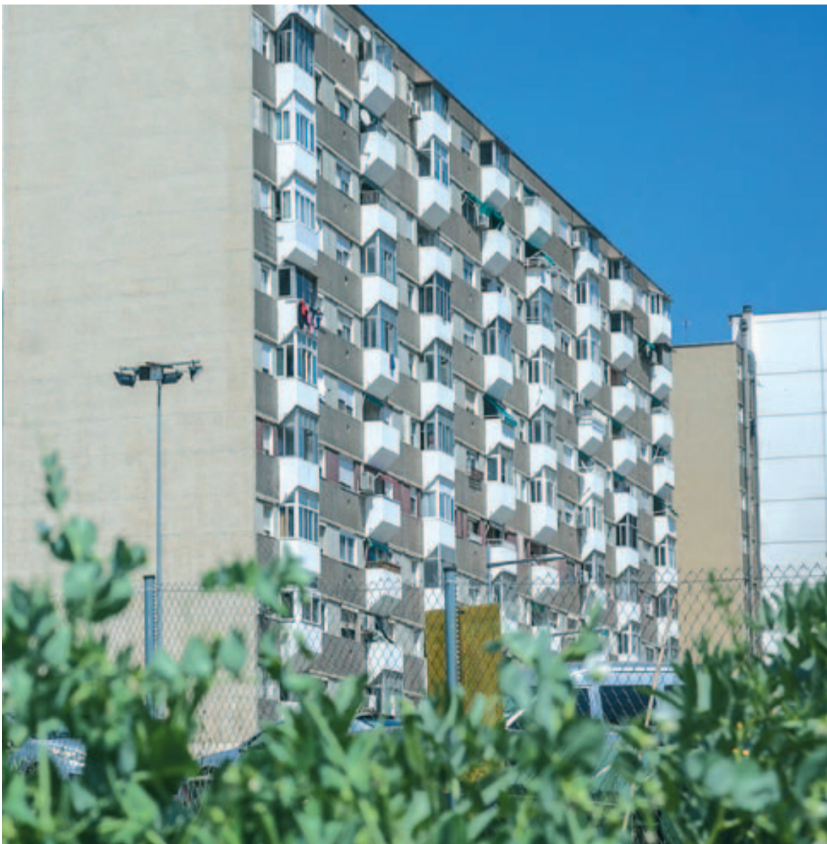
La recuperació de l'horticultura millora visualment l'entorn

que generi i de la viabilitat del projecte.