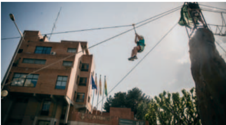
La gran tirolina a l'av. Burgos, protagonista de la diada festiva