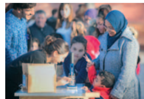
La plaça Major va oferir un munt d'activitats

també va voler transmetre un missatge intergeneracional, motiu pel qual dones de totes les edats van llegir-lo per torns.