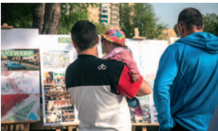
La plaça Major va presentar accions desenvolupades a altres ciutats europees