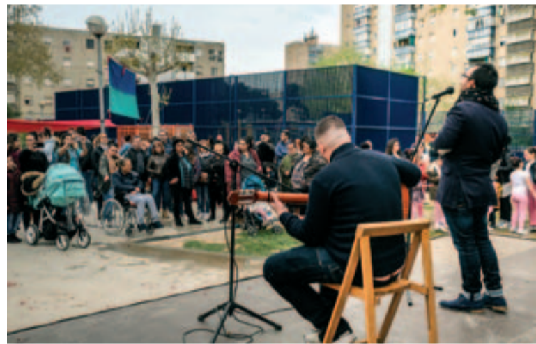
La música va tenir un paper molt important a la celebració