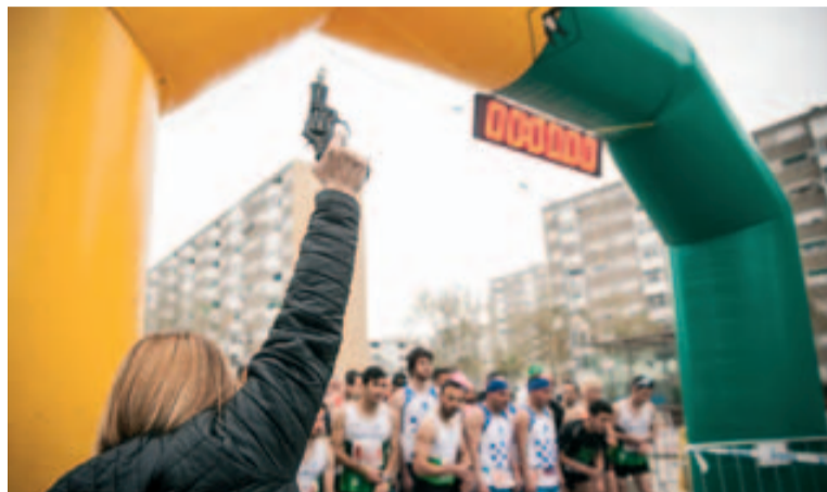
L'alcaldesa va disparar el tret de sortida de la cursa

La Cursa va lluitar contra els elements i va arribar a bon termini gràcies a tothom que la va fer possible, des dels voluntaris de Protecció Civil de Badia, a la resta de voluntaris i als equips tècnics que van resoldre totes les incidències que s'anaven produint en una jornada que, en cap