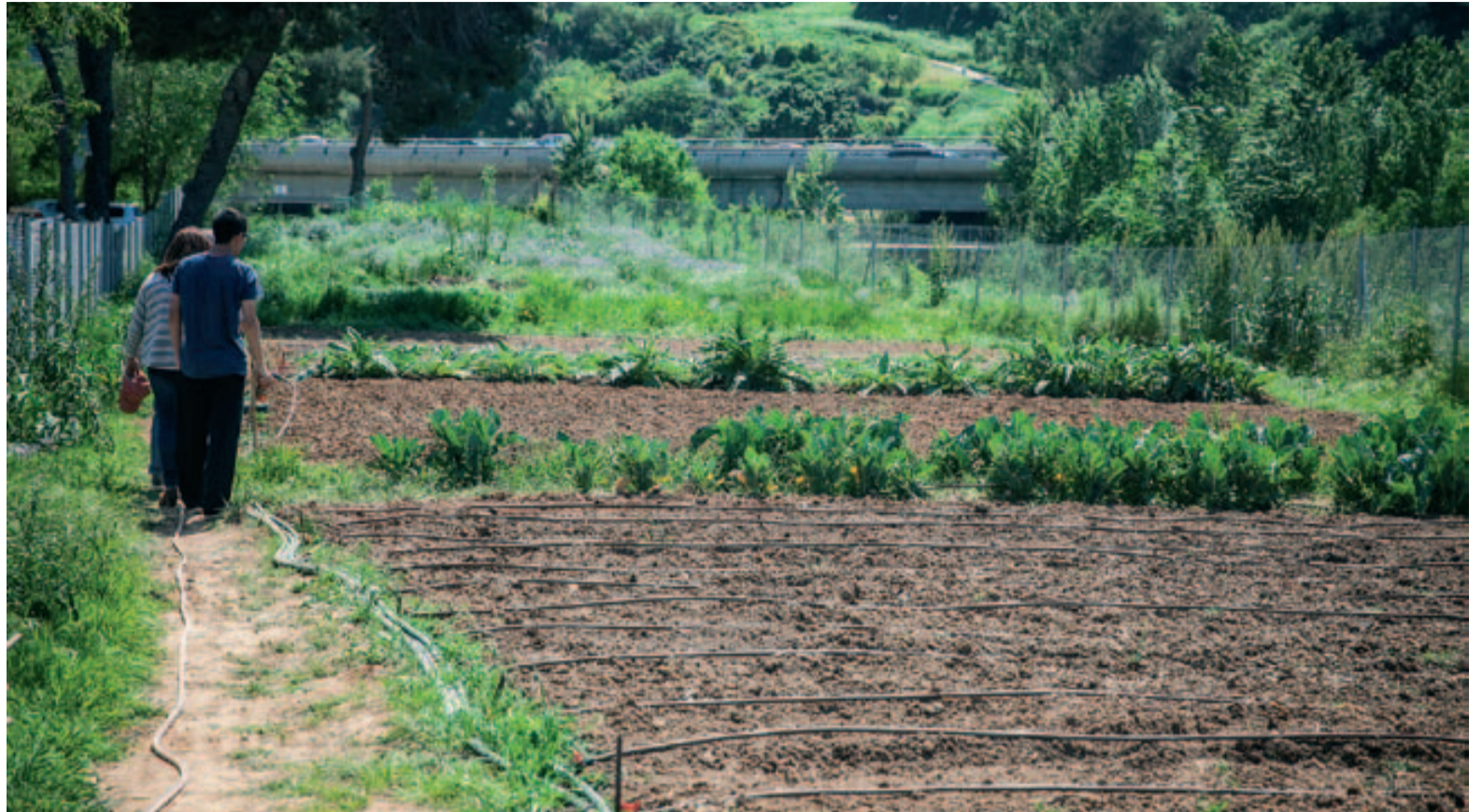
Els horts urbans són un espai verd que facilita la gestió sostenible dels recursos

De la mateixa manera, pel que fa als residus, s'hi faran controls preventius per detectar si hi ha materials que necessiten de procediments de retirada específics. L'Ajuntament ha creat comissions de seguiment perquè totes