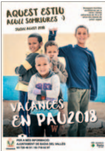
Cartell de la campanya

Vacances en Pau és un programa que fa possible que infants sahrauís puguin sortejar els estralls de les altes temperatures als campaments de refugiats durant els mesos d'estiu. Aquest any es vol que més de 500 infants sahrauís siguin acollits per famílies catalanes en el programa Vacances en Pau en què l'any passat van participar més de 150 municipis catalans. Badia del Vallès és un dels ajuntaments que participen en aquest projecte com a part de la seva col·laboració amb els representants de la República Sahrauí.