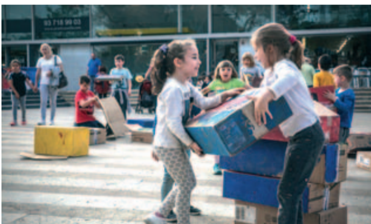
La Diada Festiva Imagina Badia va oferir activitats per a totes les edats