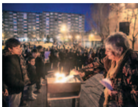
Creuant missatges contra les dones, a l'akelarre feminista

La lectura del manifest, un al·legat per l'equiparació real i la igualtat d'oportunitats efectiva entre dones i homes,