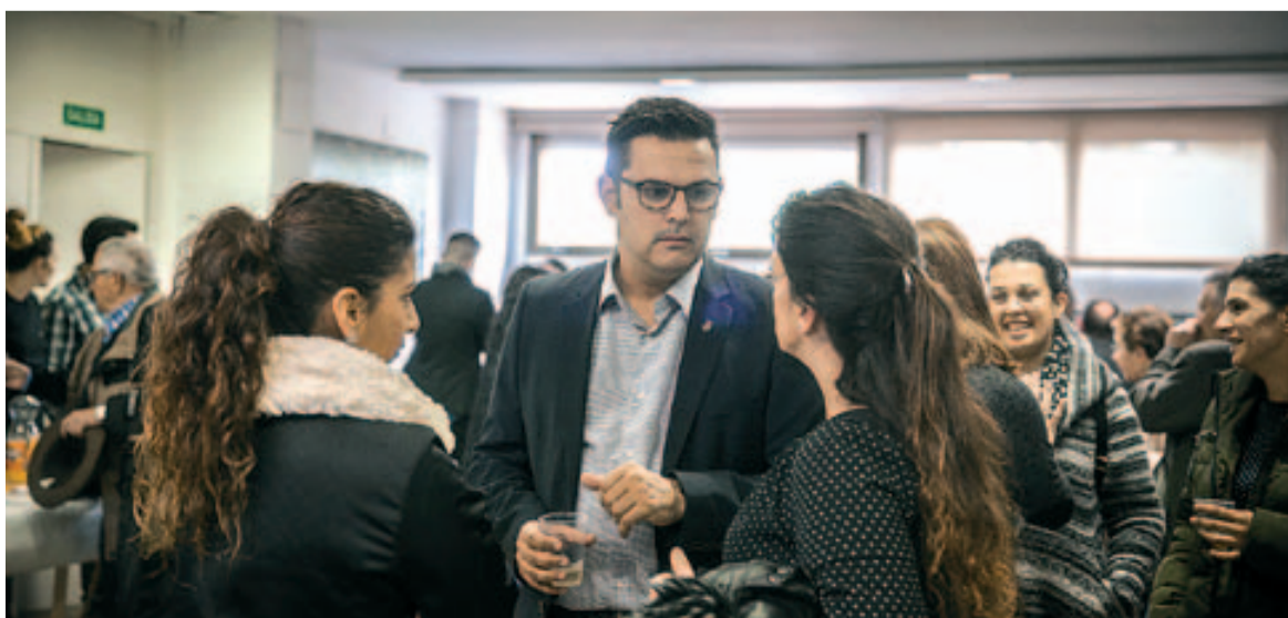
Un cop finalitzats els parlaments, els assistents van departir sobre la ciutat