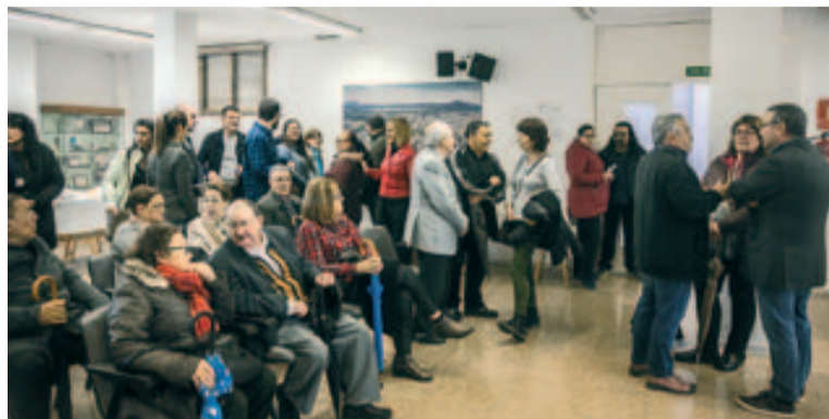
Degut a la pluja, l'acte es va celebrar a la Sala d'Actes de l'Ajuntament

Dissabte, 14 d'abril, Badia del Vallès va celebrar el 24è aniversari de la seva independència, que va tenir el mateix dia d'abril de 1994. Tot i que la intenció inicial era celebrar l'acte institucional al Parc Joan Oliver, finalment va haver-se de fer a la Sala de Plens de l'Ajuntament degut a la pluja, que va arribar a la ciutat tal com indicaven les previsions.