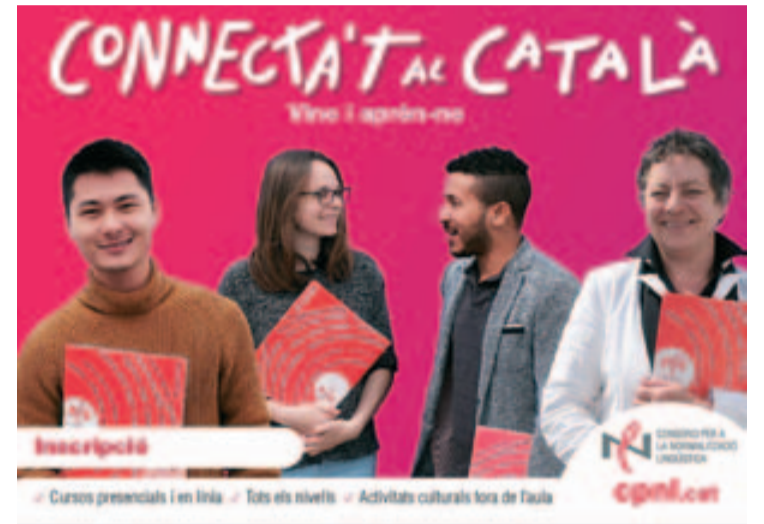
Imatge promocional dels cursos de català

El Servei Local de Català (SLC) de Badia del Vallès ha iniciat els cursos de català, el 3 d'abril. Com sempre, l'oferta ofereix cursos presencials i a distància i, com a novetat, sessions d'introducció a la llengua oral (10 h gratuïtes).