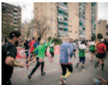
Tot i la pluja, una gran jornada per a l'esport

Disposau de la llista de tots els guanyadors a la pàgina oficial de la cursa, però, més enllà de premis i classificacions, la jornada es recordarà per com tothom va fer esport en un entorn festiu, divertit i col·laborador, malgrat la pluja. ■