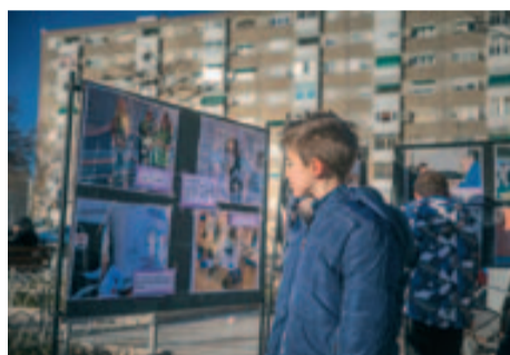
Els panells de l'exposició fotogràfica