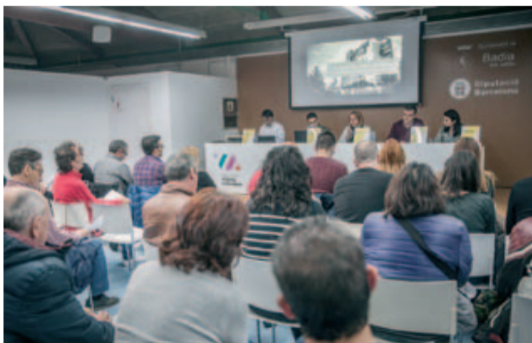
A la presentació es van analitzar els diferents articles que tracta l'ordenança

tothom ha de dur a terme accions per assegurar una millor convivència. També va explicar que el pressupost fixa els recursos de què disposa l'Ajuntament per a temes com la neteja o la seguretat.