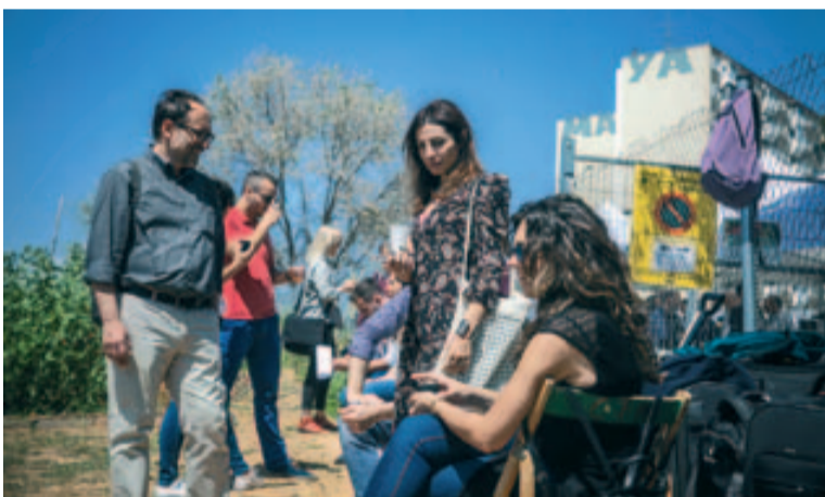
Els representants de les ciutats europees que participaven a URBACT