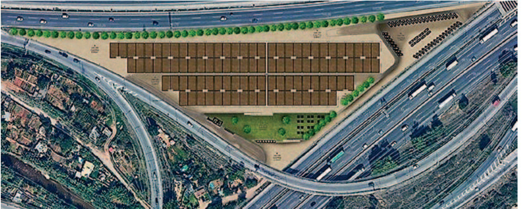
Els nous horts urbans de Badia del Vallès

Badia comptarà amb nous horts urbans municipals de titularitat pública entorn de la C-58. Les obres d'ampliació de l'autopista, a les quals el consistori es va oposar, oferiran, com a contrapartida positiva, que Badia disposi d'aquesta nova instal·lació, d'aproximadament 2 hectàrees de superfície, per regular els cultius que, fins ara, es feien de manera irregular i sense cap mena de seguretat jurídica.