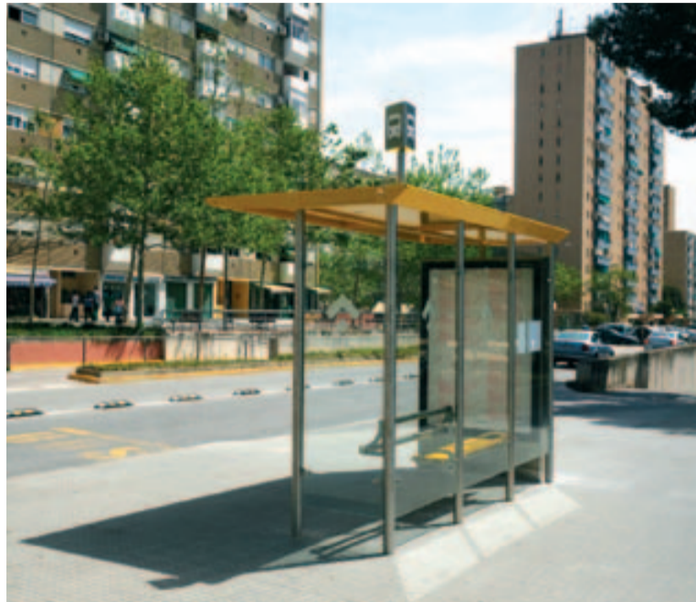
La nova marquesina a l'av. de Burgos

El nou mobiliari urbà dona resposta a una reivindicació històrica de la ciutat i assegura la protecció dels usuaris del transport públic davant les inclemències del temps. Així mateix, les marquesines incorporen seients que ofereixen més comoditat als seus usuaris durant el temps d'espera fins a l'arribada de l'autobús. ■