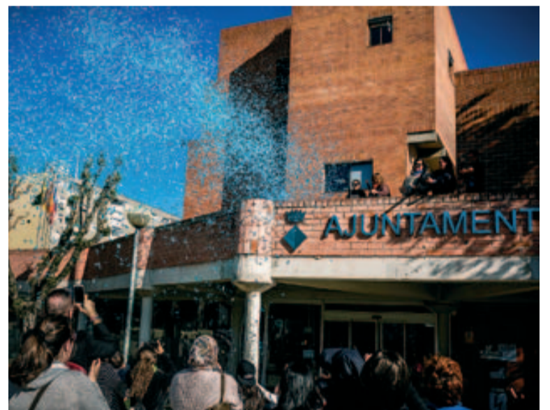
L'explosió de confeti va finalitzar l'acte de commemoració del Dia Mundial de l'Autisme

Molts espais i edificis públics d'arreu del món s'il·luminen en blau el 2 d'abril com a part de la campanya internacional Light It Up Blue, endegada per l'organització Autism Speaks. ■