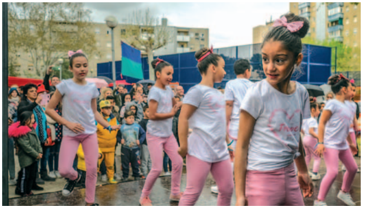
Las Chay's van oferir les seves coreografies, tot i la pluja