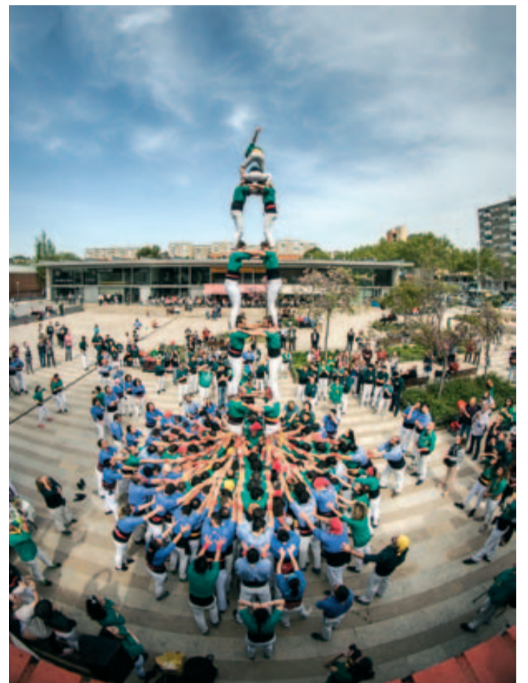
Un dels castells coronats a la plaça Major

La jornada castellera va posar un punt final espectacular als actes de la Diada de Sant Jordi, que va omplir Badia de roses i de cultura. ■