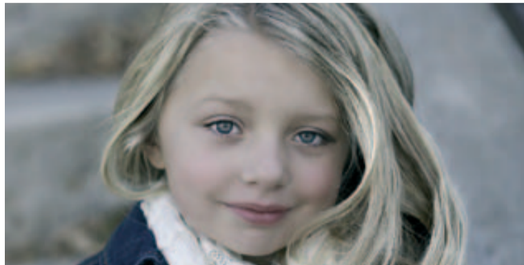
Un projecte perquè els més joves puguin pensar en els seus projectes de vida

L'àrea de Promoció Social i Acompanyament Educatiu està impulsant un nou projecte anomenat "Tenim futur", adreçat principalment a l'alumnat de les escoles de primària de Badia del Vallès. El projecte impulsa, a partir d'experiències lúdiques, que els infants del municipi puguin començar a pensar en els seus projectes de vida, més enllà dels estereotips de qualsevol tipus.