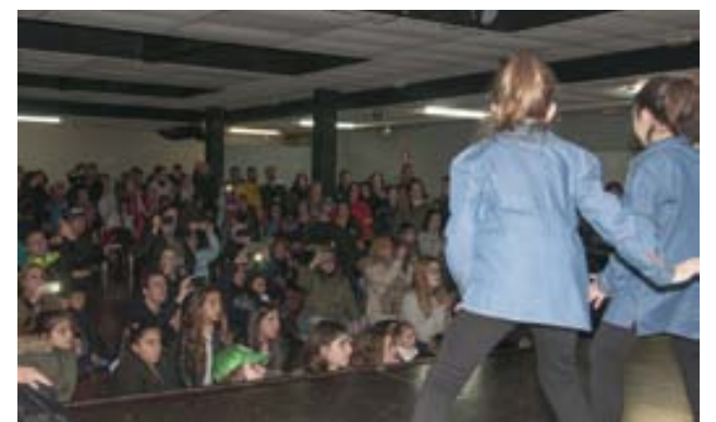
Activitats adolescents Carnaval 2018