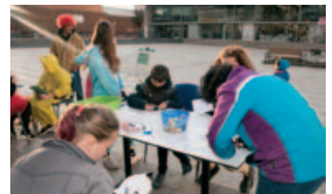
Tallers Carnaval 2018