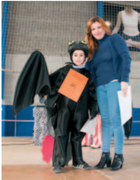
Millor disfresa Individual "El drac desdentao"