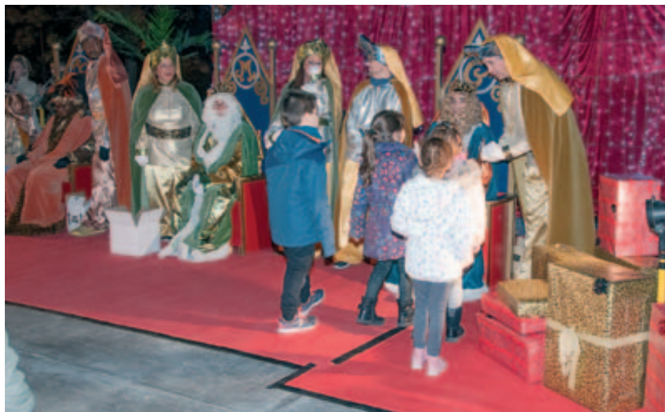
Ses Majestats el Reis Mags d'Orient recollint cartes al tro reial

Per aquest motiu, l'Ajuntament de Badia del Vallès vol felicitar totes les persones i entitats que hi van col·laborar i posar en valor, així mateix, la feina duta a terme per la Policia Local i els membres de Protecció Civil, en el manteniment de l'ordre i la seguretat durant l'esdeveniment.