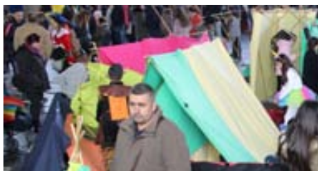
Taller de Cabanes a càrrec de l'Obrador durant el Carnaval infantil i familiar