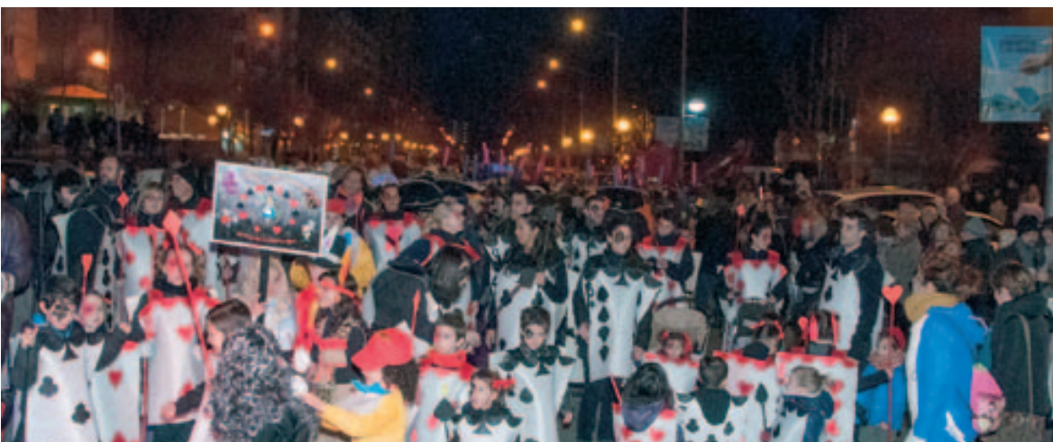
Rua Carnaval Popular