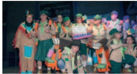
Premi a la millor Comparsa del Carnaval Popular "Bollis Cao"