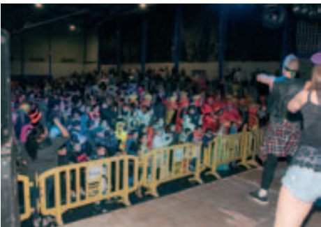
Grup animació Carnaval Popular