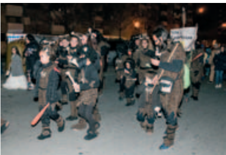
Rua Carnaval Popular