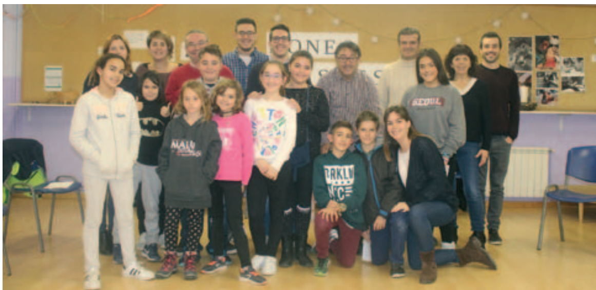
Reunió Consells d'Infants amb els regidors i regidores per debatre sobre l'Ordenança de Civisme i Convivència