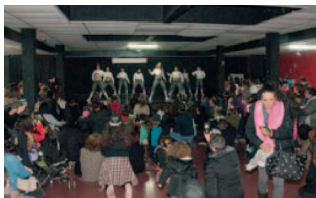
Activitats adolescents Carnaval 2018