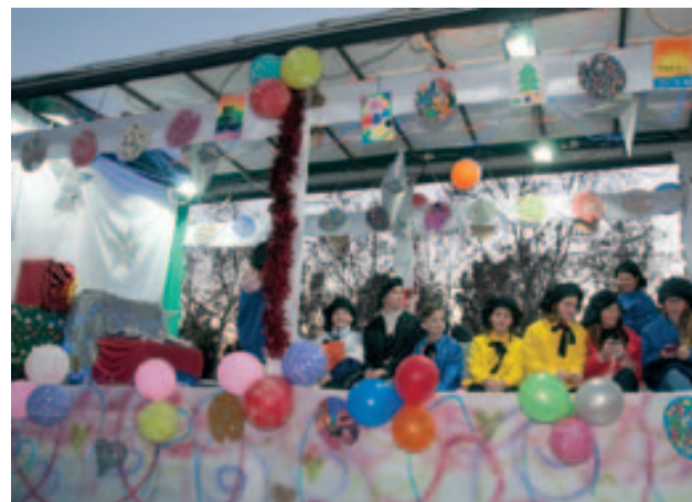
La carrossa del rei Gaspar "els Pintors"