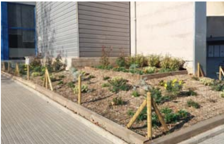
Cantonada del carrer dels infants i l'Av. Via de la Plata