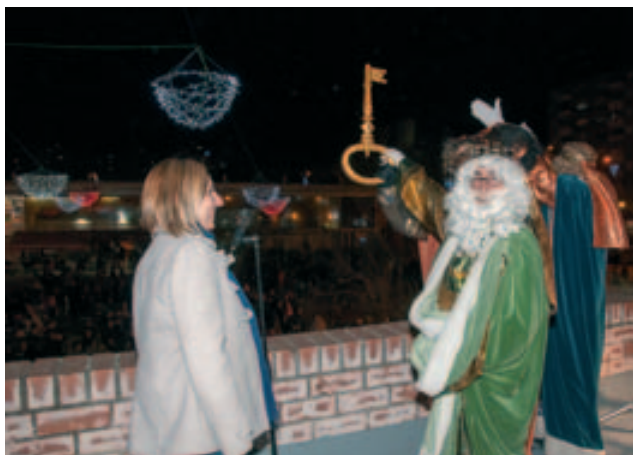
Ses Majestats els Reis Mags d'Orient amb la clau de la ciutat