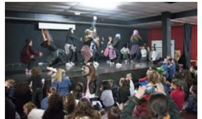
Activitats adolescents Carnaval 2018