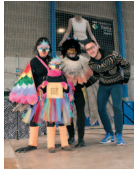
Millor disfresa familiar "Familia d'Ocells"