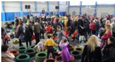
Tallers infantils durant el Carnaval infantil i familiar