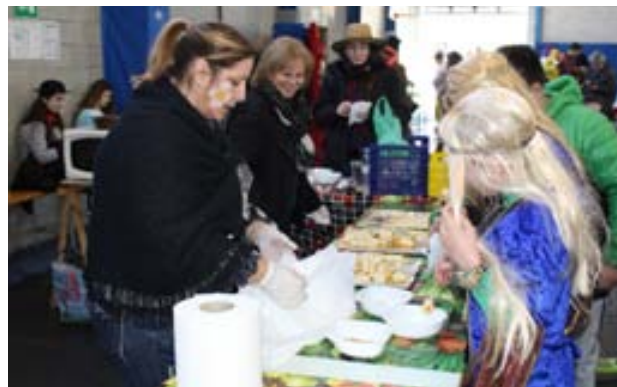
Xocolatada a càrrec de la PAH