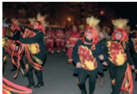
Rua Carnaval popular