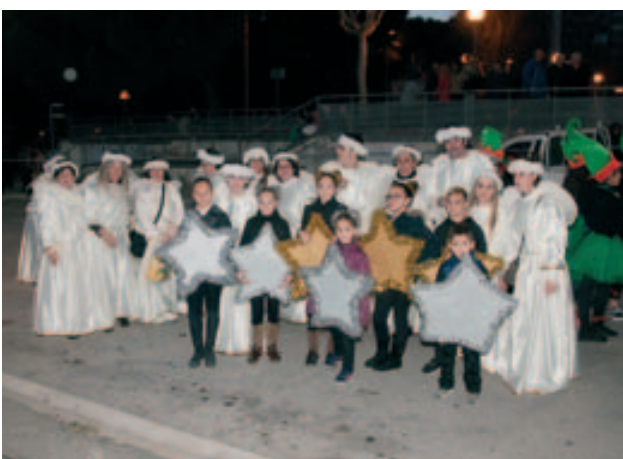
La comparsa dels Angelets de La Hermandad Virgen del Rocío