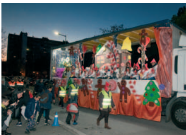
La carrossa del rei Melcior "La caseta de xocolata"