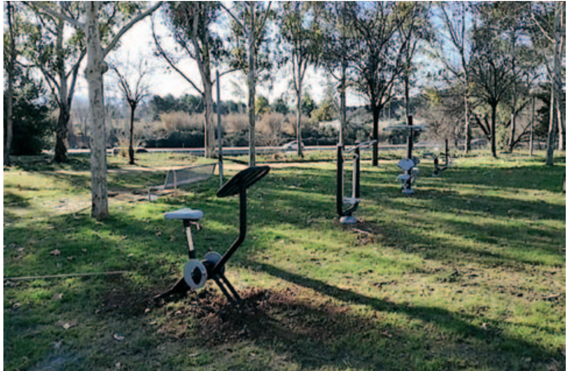
Alguns dels elements instal·lats per a la ruta biosaludable

Dins de la ruta circular, es van decidir tres ubicacions dels elements que exerciten totes les parts del cos. Un grup s'ha col·locat al carrer de Menorca (al final de la pantalla acústica); un altre, al carrer de Mallorca i els últims, al carrer de Santander (darrera dels números 8 i 10).