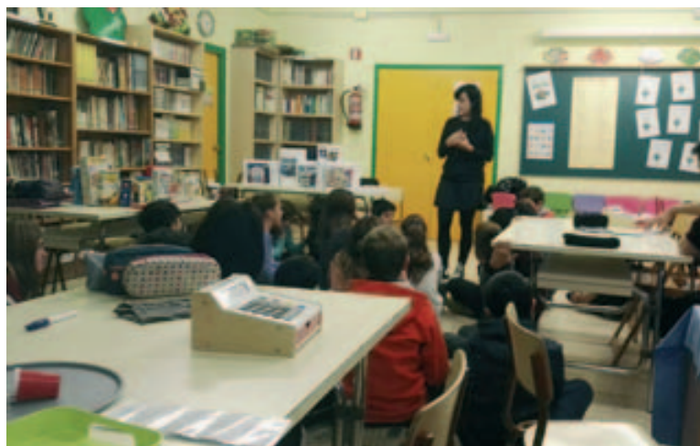
Els alumnes de 6è de primària de l'Escola la Jota aprenen sobre consum responsable

Els alumnes, organitzats en grups de 4 a 6 integrants, havien d'adoptar un rol determinat (venedor/comprador). En finalitzar l'escenificació, els alumnes ho van posar en comú i d'aquesta manera, van poder explicar i compartir la seva experiència en les diferents fases del taller. ■