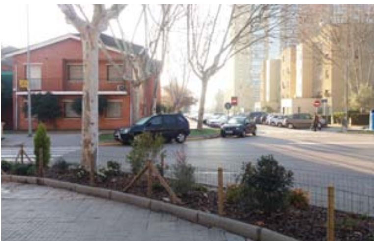
carrer de la Manxa amb carrer de la Bètica