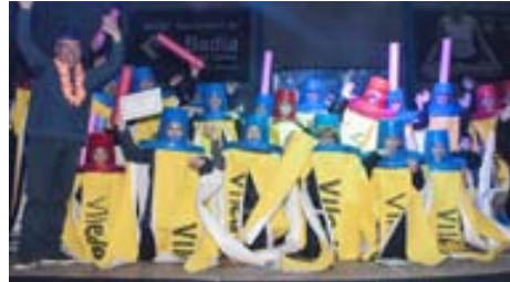
Premi a la segona millor Comparsa del Carnaval Popular "Los Kelis"