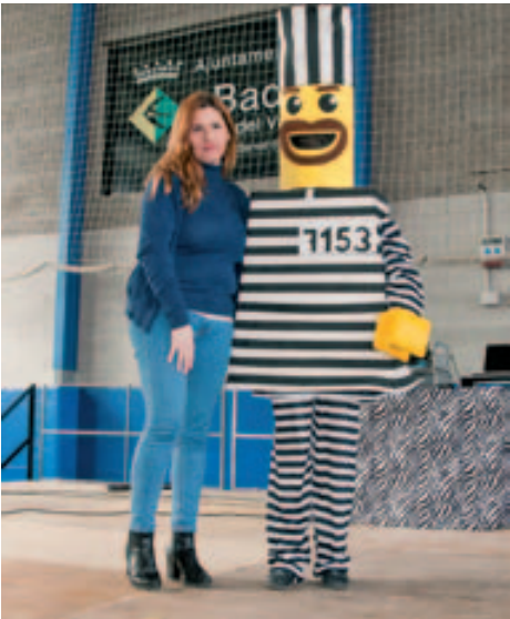
Millor disfresa Individual del Carnaval Popular "Playmobil Encarcelado"