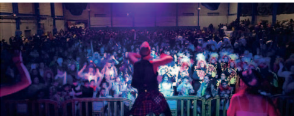
Grup d'animació Carnaval Popular