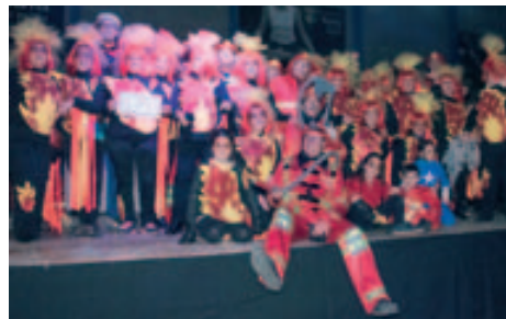
Premi a Comparsa Més divertida del Carnaval Popular "Mujeres de Fuego y Bomberos"