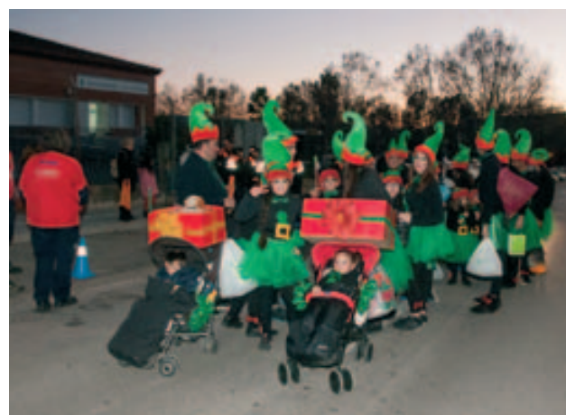
La comparsa dels Follets de la PAH