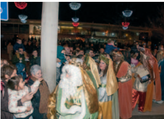
Ses Majestats els Reis Mags d'Orient i els patges reials