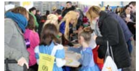
Tallers infantils durant el Carnaval infantil i familiar