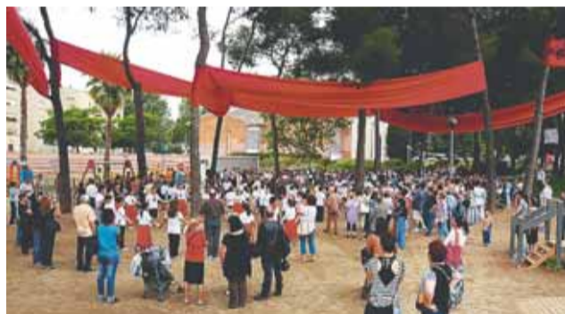
Dances escolars de sardanes i cercavila infantil amb la Cobla Contemporània al Parc Joan Oliver

L'epíleg de la Festa Major va venir de la mà de l'espectacle "Foc a la Carta" , una mostra de llum, foc i molta intensitat que deixarà el regust d'unes immillorables Festes Majors. Només mentre no arribin les de l'any vinent! ■