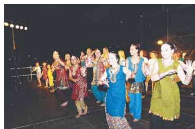
Espectacle de Bollywood