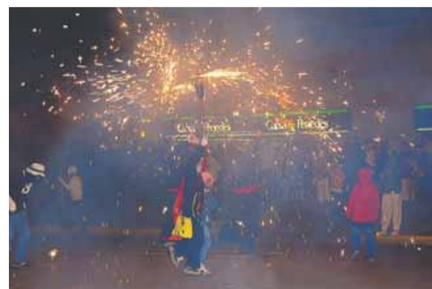
Correfoc a càrrec de la Colla de Diables de Badia del Vallès