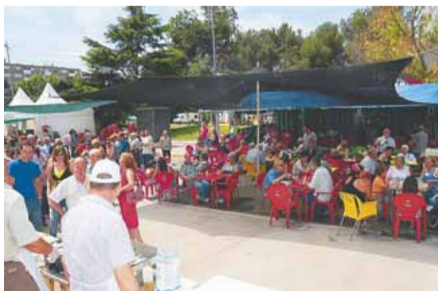
170 Kg de sardines a la tradicional "Sardinada Popular"