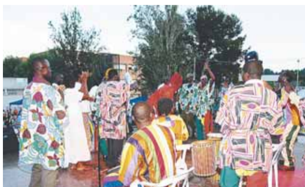
XIII Trobada i VI Mostra Gastronòmica. Festa ritual senegalesa "Diambalong" (Associació Senegalesa Dinnah-ba-Catalunya)