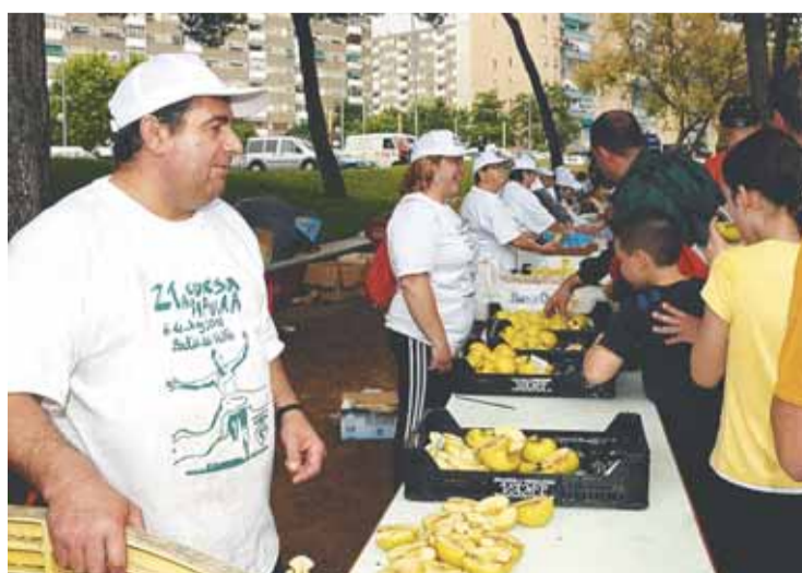
Parada de fruita durant la 21ª Cursa Popular

accent fresc i saludable a la festa. A més a més, tots els punts gastronòmics presents a la festa s'han implicat en la Campanya recomanant mitjançant cartells els seus productes i plats saludables i ens informaven dels beneficis que ens aportava per a la nostra salut. Per últim, en tots els espais que tenien a veure amb activitat física, s'adherien al explicar-nos, també mitjançant cartells, els beneficis