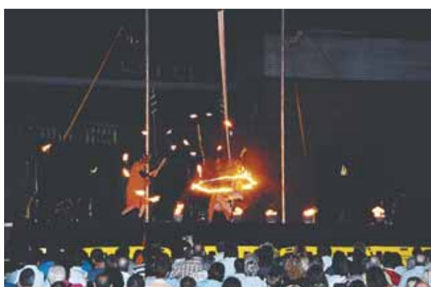
Espectacle "Foc a la Carta"