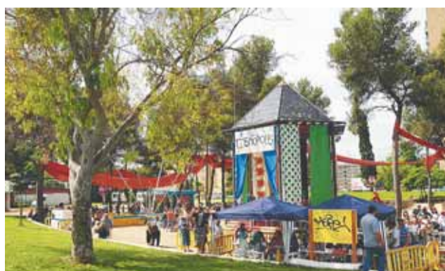
Badia Cosmópolis, Taller de reciclatge, Taller de maquillatge i Fira Infantil