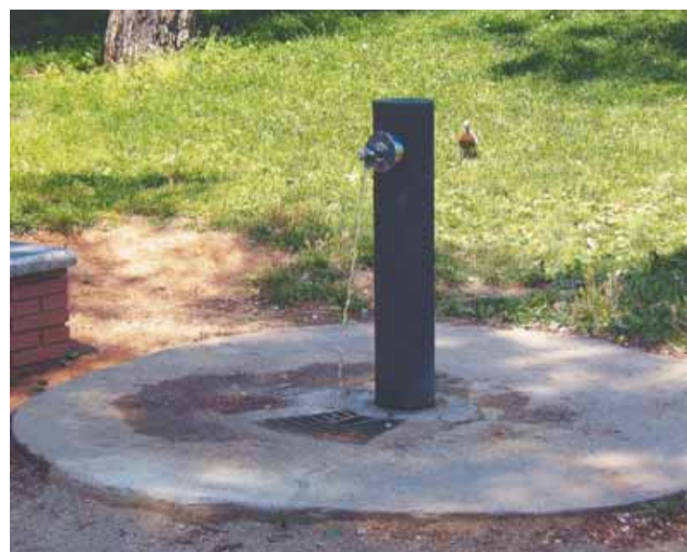
Font Parc Joan Oliver

El passat mes de juny es van portar a terme obres de millora al Parc Joan Oliver. Una actuació que va consistir en canviar el sistema de drenatge de la font existent.