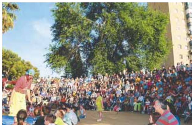
Circ de Pallassos