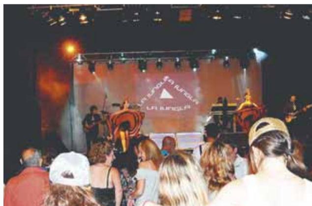
Orquestra "La Jungla"