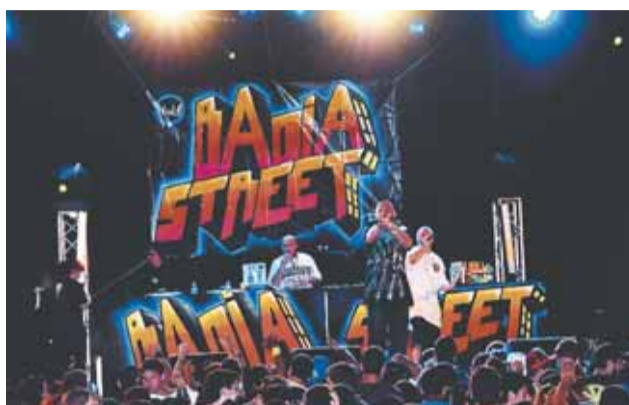
Badia Street Vol. 1