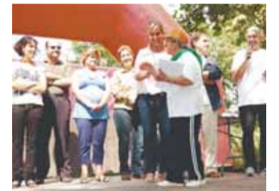
Lliurament de diplomes

Els assistents van poder gaudir d'una jornada plena d'activitats. Durant el matí van poder realitzar un circuit combinat de tallers recreatius: de consciència corporal, ritme, balls amb coreografia, fisioteràpia, estiraments, massatges, relaxació, tai-txí i dansa oriental. A més, també es van fer trams de passejades pels voltants del Mas