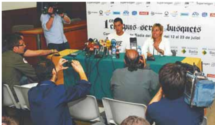
Jugador del F.C Barcelona, Sergio Busquets i l'alcaldessa de Badia del Vallès, Eva Menor

El Campus tindrà lloc al Camp Municipal de Futbol de Badia del Vallès, durant el mes de juliol (del 12 al 23). És una iniciativa del propi Sergio Busquet i compta amb el patrocini institucional