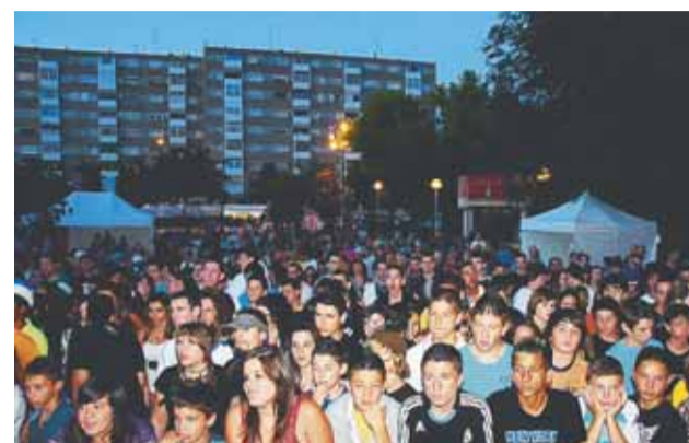
Multitudinària presència al "Badia Street Vol. 1"