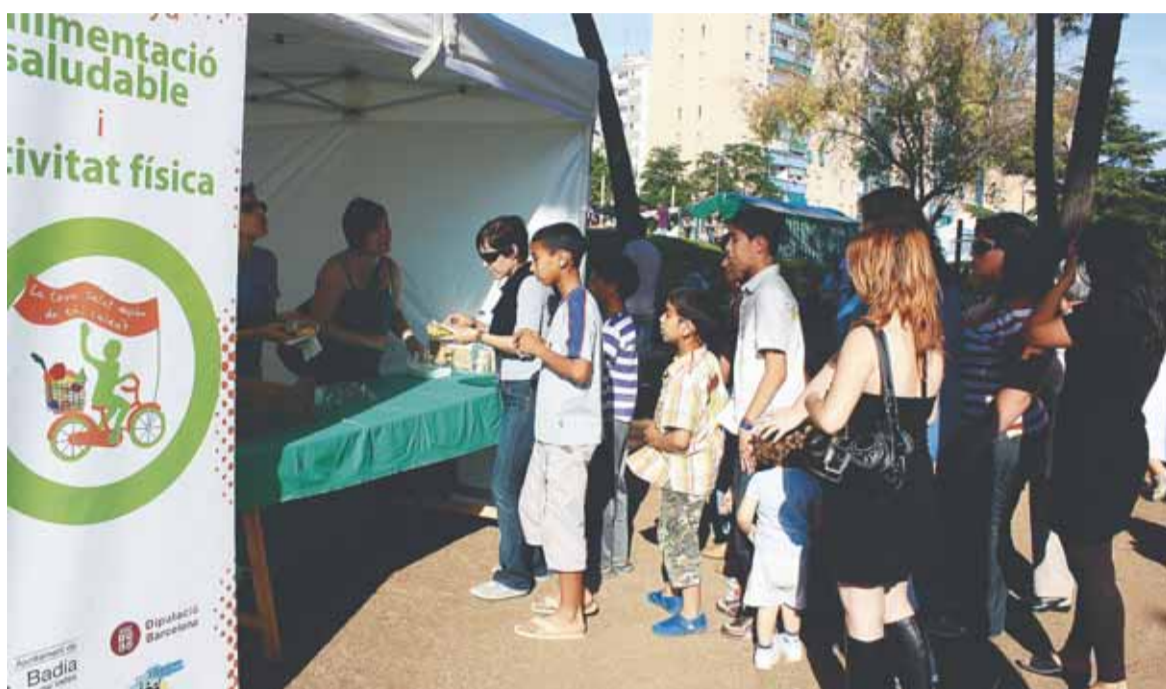
Parada de macedònia durant la Festa Major

Per tant, el Servei de Salut i Hàbits Saludables amb la col·laboració de tots els/les integrants de les comissions de salut del Pla Educatiu d'Entorn, llança des del mes de juny de 2010 la Campanya d'alimentació saludable i activitat física a Badia del Vallès. Una iniciativa dirigida a tota la població de Badia i que durarà fins juny de l'any vinent. Per tal de portar a terme una campanya de tothom i per a tothom és fonamental considerar totes les etapes del cycle vital, i involucrar diversos àmbits de la nostra comunitat: familiar (famílies, AMPA, etc), Educatiu (Llars, Escoles,