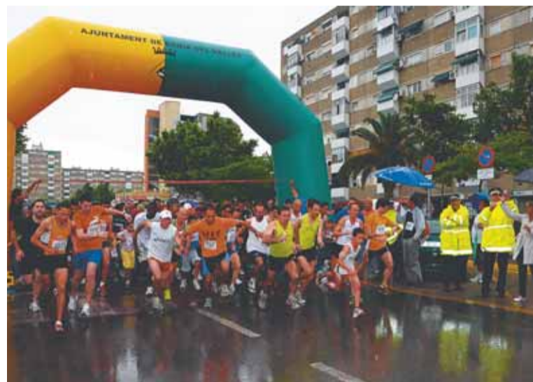
Participants de la 21 a Cursa Popular

Badia del Vallès celebra aquesta tradicional cursa des de l'any 1989 amb un gran èxit de participació. Aquest any, a més, la data coincideix amb la Festa de l'Esport i el dia de l'Esport a tota Europa. ■