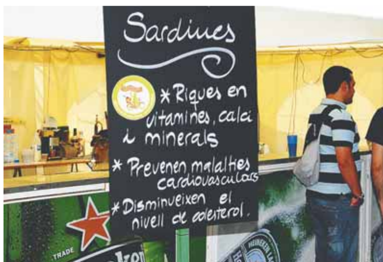
Punt gastronòmic Saludable