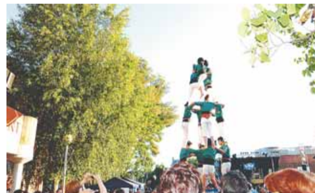
Castellers de Cerdanyola del Vallès