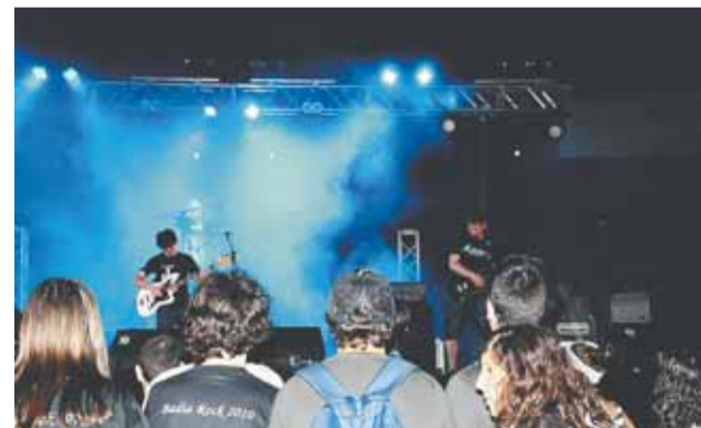
Badia'n'Rock a càrrec de l'AIGMB