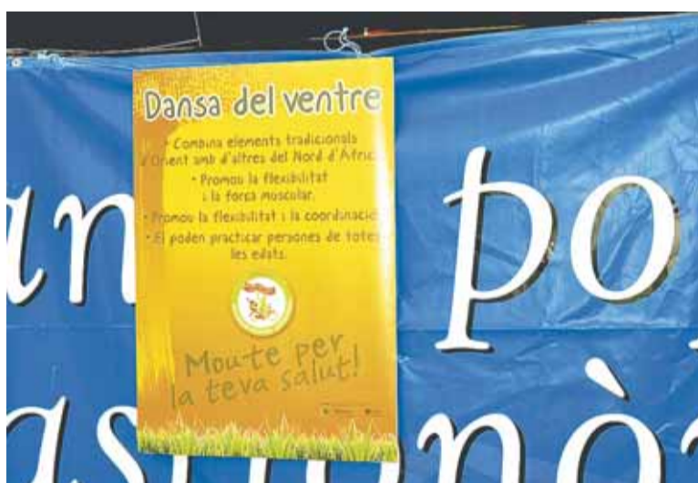
Cartell explicatiu dels beneficis de la dansa del Ventre

Fomentar accions encaminades a millorar hàbits en relació a la dieta i a augmentar l'activitat física en tots els sectors de la comunitat.