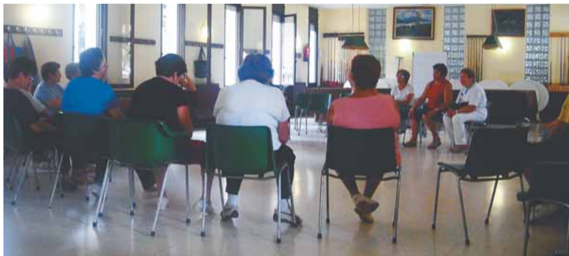
Participants del taller de teatre

Al principi del mes de juny, l'Ajuntament, en col·laboració amb la Diputació, ha proposat dues sessions de teatre, que han tingut un alt grau de participació.