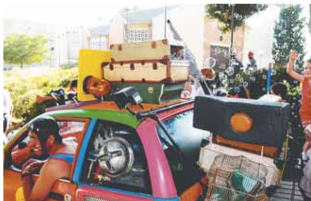
Cotxe ple de màgia