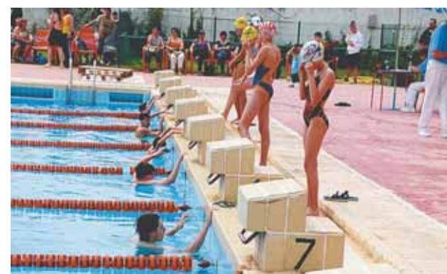
1er trofeu FEsta major de Natació al Poliesportiu antic