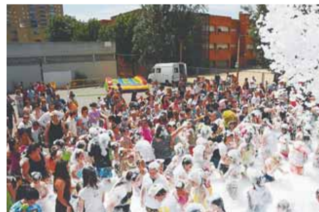
Festa de l'escuma