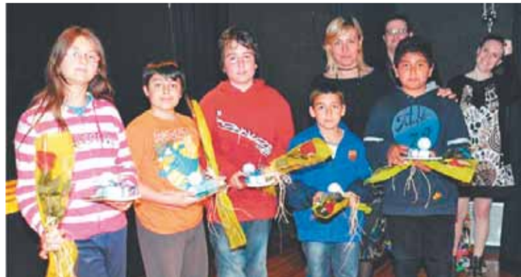
Liurament de premis Certàmen Literari Sant Jordi

A la tarda, es va organitzar també una ballada de sardanes a la plaça de l'Ajuntament. Una jornada plena d'activitats que va vestir la ciutat amb les tradicionals parades de roses i llibres que tant caracteritzen la diada de Sant Jordi. ■